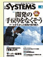
【システム構築事例が満載】 日経SYSTEMS 06年4月創刊号～