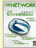
【ネットワーク技術の学習誌】 日経NETWORK 00年5月創刊号～