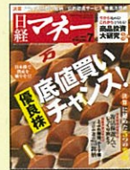
【マネー&ライフプラン応援】 日経マネー 05年10月号～