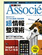
【次世代ビジネスリーダーのための情報誌】 日経ビジネスアソシエ 08年4/15号～