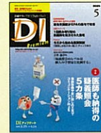
【医薬品・調剤・服薬の実務情報】 日経ドラッグインフォメーション 00年1月号～