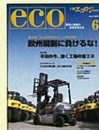
【企業の環境戦略・活動・商品】 日経エコロジー 99年7月創刊号～