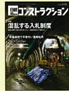
【土木・建設のニュースと技術】 日経コンストラクション 98年7/24号～