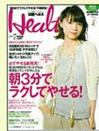
【健康に、美しく】 日経ヘルス 06年7月号～