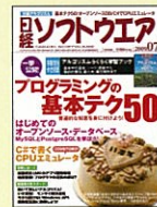
【プログラミング技術情報】 日経ソフトウェア 99年7月号～