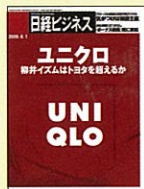
【NO.1経済・経営誌】 日経ビジネス 69年10月創刊号～