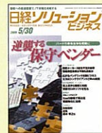
【ITマーケット情報誌】 日経ソリューションビジネス 98年1/23号～