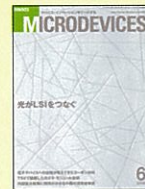
【電子デバイス技術の情報誌】 日経マイクロデバイス 98年1月号～