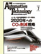
【自動車の技術と市場】 日経Automotive Technology 04年6月創刊号～