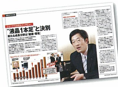
▲ 地域で頑張る元気企業