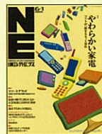
【エレクトロニクス総合誌】 日経エレクトロニクス 98年8/10号～