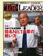
【起業家・経営者を支援】 日経トップリーダー 99年4月号～