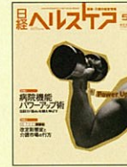
【医療・介護ビジネス情報】 日経ヘルスケア 99年4月号～