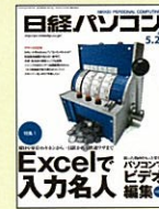
【NO.1パソコン情報誌】 日経パソコン 97年10/6号～