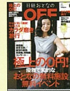
【人生をより豊かにするオフ生活情報誌】 日経おとなのOFF 07年8月号～