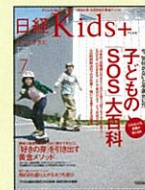
【親子で楽しむための生活情報誌】 日経キッズプラス 07年9月号～