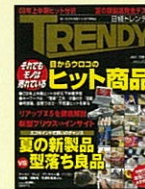
【個人生活を刺激する流行情報誌】 日経TRENDY 06年5月号～