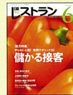
【フードビジネスの総合誌】 日経レストラン 99年4月号～