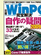
【『買いたい』『使いたい』を刺激する】 日経WinPC 09年4月号～