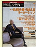
【ITを活かした戦略経営情報】 日経情報ストラテジー 98年5月号～