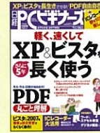
【パソコン初心者応援】 日経PCギガーズ 07年3月号～