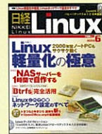
【Linuxの技術・実務情報】 日経Linux 99年10月創刊号～