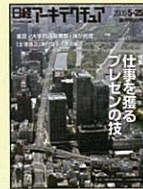
【建築士のための総合情報誌】 日経アーキテクチャ 99年4/5号～