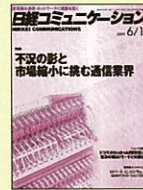
【通信・ネットワーク総合誌】 日経コミュニケーション 98年1/5号～