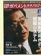
【電子自治体サービス実務】 日経BPガバメントテクノロジー 03年7月創刊号～