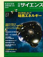
【総合科学誌】 日経サイエンス 00年1月号～