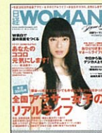
【女性の仕事と暮らし】 日経WOMAN 05年9月号～