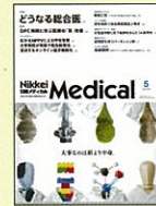
【臨床医のための総合医療情報誌】 日経メディカル 98年8月号～