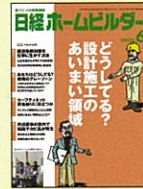
【住宅技術者の実務情報誌】 日経ホームビルダー 99年7月創刊号～