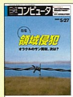
【情報システム総合情報誌】 日経コンピュータ 98年3/2号～