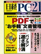
【実用的なパソコン誌】 日経PC21 05年3月号～