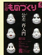
【製造業の技術革新支援】 日経ものづくり 98年8月号～